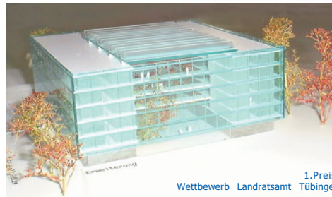
1. Preis, Wettbewerb Landratsamt Tübingen